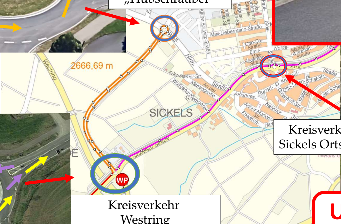
Kreisverkehr Sickels Ortsmitte